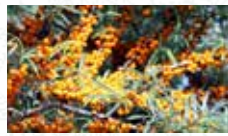
Argousier Hippophae rhamnoides