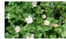
Eglantier commun (rosier) Rosa canina