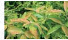
Néflier commun Mespilus germanica