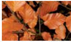
Hêtre commun Fagus sylvatica