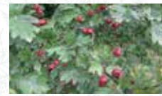
Aubépine épineuse Crataegus laevigata