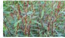
Sauge/Osier pourpre Salix purpurea