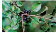
Nerprun purgatif Rhamnus catharticus