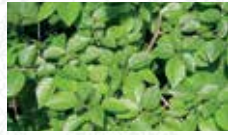
Orme champêtre Ulmus minor