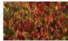
Cornouiller sanguin Cornus sanguinea