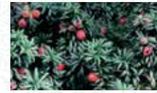
If Taxus baccata