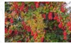
Épine vinette Berberis vulgaris