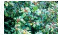
Bourdaine Rhamnus frangula