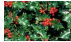
Houx commun Ilex aquifolium