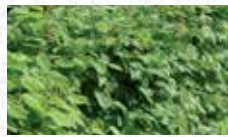
Charme commun Carpinus betulus