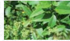
Troène commun Ligustrum vulgare