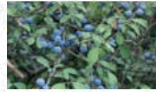
Prunellier Prunus spinosa

Choisir des variétés résistantes à la graphiose