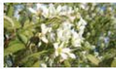
Amélanquier vulgaire Amelanchier ovalis