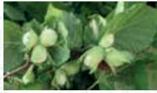
Noisetier/Coudrier Corylus avellana