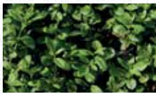
Buis commun Buxus sempervirens