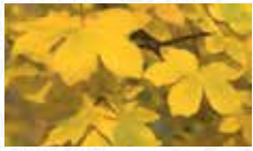
Erable champêtre Acer campestre