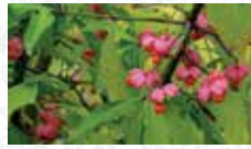
Fusain d'Europe Euonymus europaeus