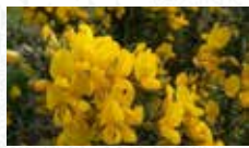
Ajonc d'Europe Ulex europaeus