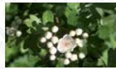
Aubépine monogyne Crataegus monogyna