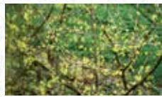
Cornouiller mâle Cornus mas